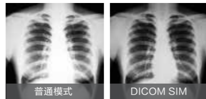
*该投影机并非医学设备，不能在日常医疗诊断中使用。

DICOM SIM 模式可以清晰的还原具有更深阴影的医疗图像 (如 X-射线数字图像和其他医疗图像)，适用于医疗教学环境中使用。